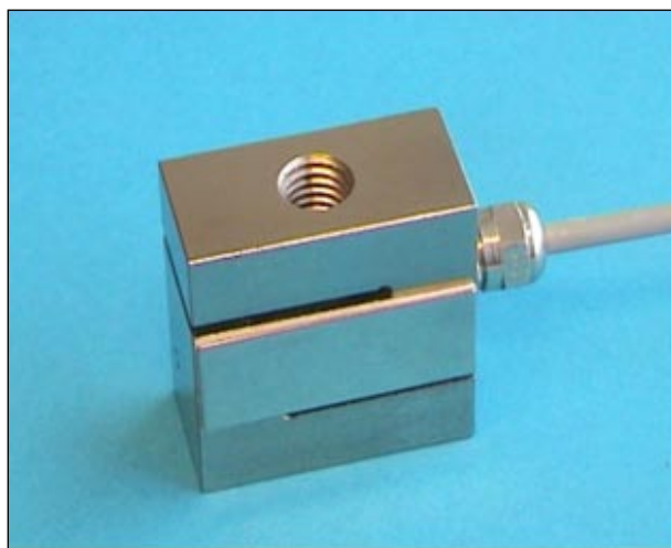
Rys. 2. Zdjęcie czujnika K1505