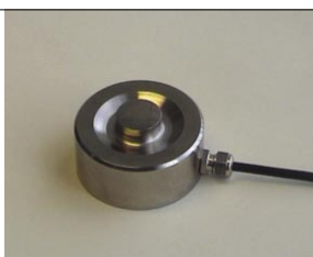
Rys. 2. Czujnik KMM50

nictwie i laboratoriach. Użycie czujnika jest bardzo łatwe z uwagi na kształt korpusu i sposób wprowadzenia siły do czujnika. W przypadku np. pomiaru wagi silosa zbożowego wystarczy podłożyć czujnik pod stopę konstrukcji silosa, uwzględniając w wyliczeniach rozłożenie sił na kolejne nogi konstrukcji. W aplikacji należy zadbać o przygotowanie płaskiej, poziomej powierzchni, która będzie stanowić bazę dla podparcia czujnika. Siła musi zostać wprowadzona na rdzeń czujnika punktowo prostopadle do powierzchni podparcia. Obowiązują tu ogólne reguły, jakich należy przestrzegać przy aplikacji czujników tensometrycznych do pomiaru siły.